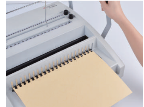
4. 벌어진 링에 천공한 종이를 넣고 핸들을 밀어 링을 닫아줍니다.