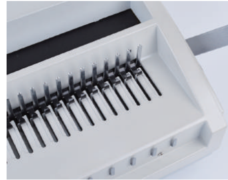
3. 플라스틱링을 제본틀에 끼우고 제본핸들을 당겨 링을 벌려줍니다.