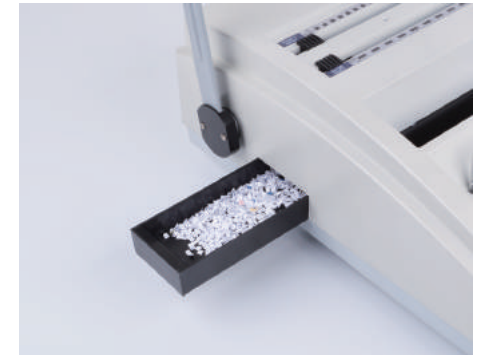
6. 제본이 끝나면 기기 왼쪽의 파지함을 비워주세요.