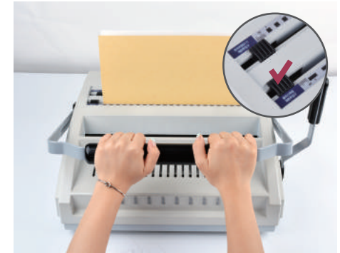
2. 천공할 용지를 정리해 앞쪽 플라스틱링 천공틀에 넣고 천공핸들을 당겨 천공해줍니다.