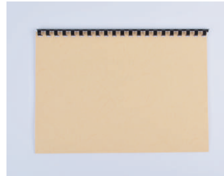
5. 제본 완성