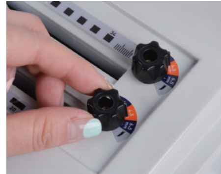
1. 용지규격조절레버와 천공마진조절 레버를 원하는 위치로 설정합니다.